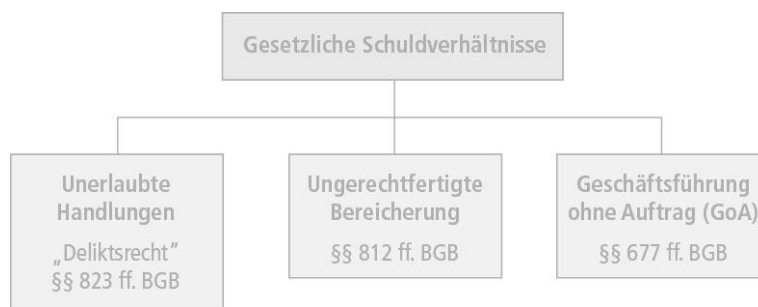
Abbildung 14.2: Gesetzliche Schuldverhältnisse