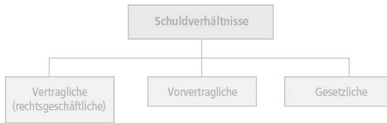
Abbildung 14.1: Schuldverhältnisse